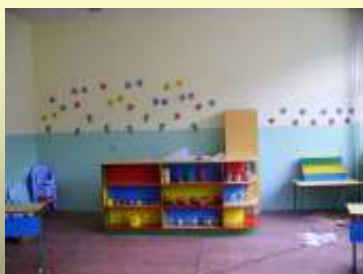
Снимка на кът